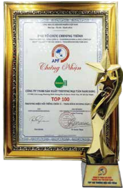
DANH HIỆU TOP 100 THƯƠNG HIỆU XUẤT SẮC CHÂU Á - TBD 2021